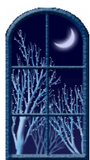
Tempo di Natale

Mescolando abilmente gli elementi tipici del romanzo classico e di quello fantastico, l'autrice scandaglia da un'angolazione inusuale gli aspetti più reconditi di una realtà solo apparentemente sotto gli occhi di tutti, in cui anche la fantasia si incarica di dar voce all'ineffabile.